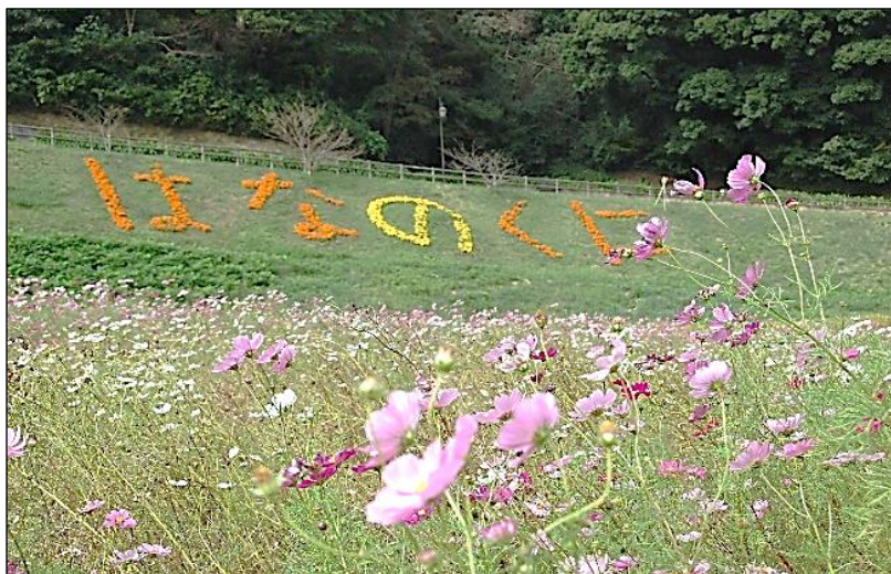
横須賀市「くりはま花の国」