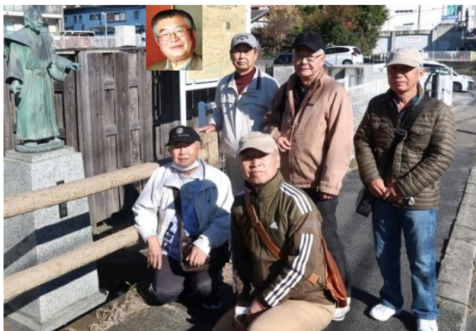
最初の休憩は藤田東湖記念碑前(撮影者・中谷さんは左上)

懇親会は生ビールで乾杯！海鮮丼&酒の追加で近況や情報交換等で歓談。終了後はカラオケ会で楽しみました。