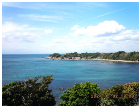
展望台から望む荒崎海岸