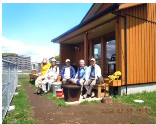
今日はコテージでお泊り飲むぞー