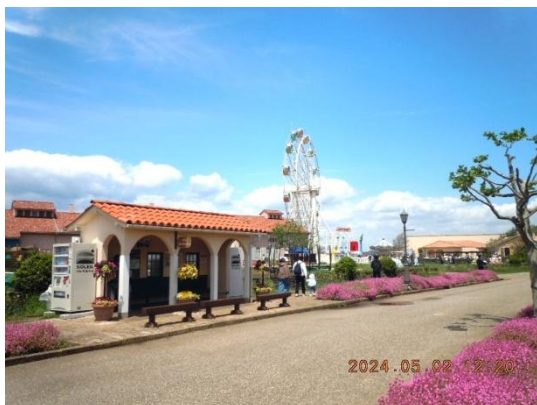
トレイン駅と観覧車