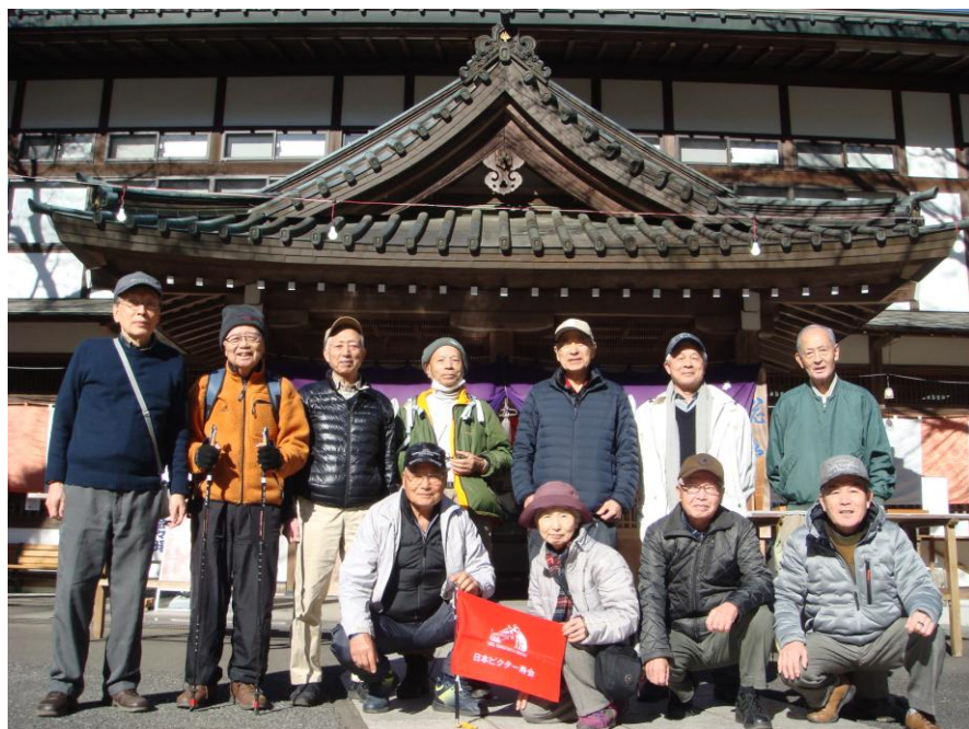
最乗寺本殿前にて

令和6年最初のハイキングは曹洞宗の古刹、天狗伝説でも名高い大雄山最乗寺です。 今年1年の安寧を祈願して参拝をしました。