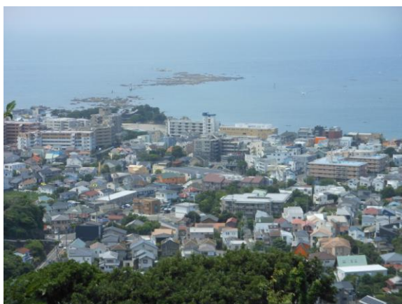
仙元山から葉山森戸海岸を望む