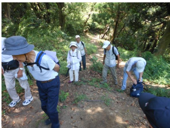
葉山教会への急坂