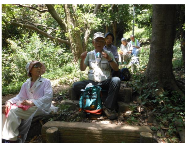
急階段に腰掛け昼食