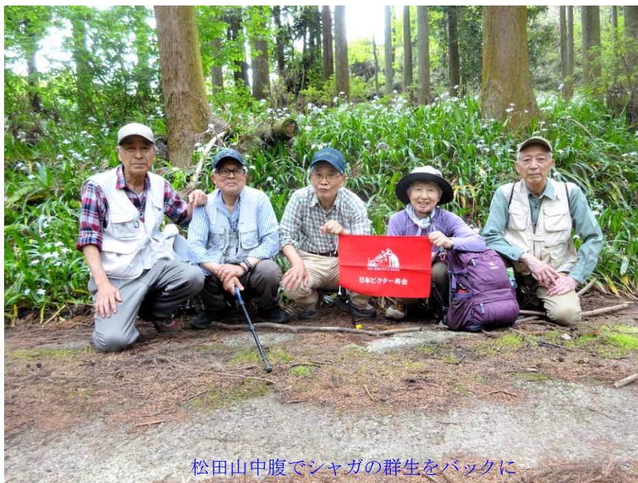
松田山中腹でシャガの群生をバックに

松田山登山口をスタートして新ルートで最明寺史跡公園を目指したが、道に迷ってしまい目的地を断念して松田山中腹から下山、2万2千歩のハイキングでした。