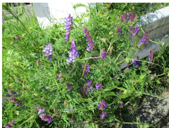
松田山登山口の野花