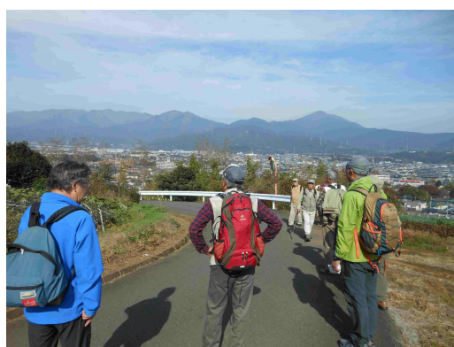
秦野の里山から大山を望む