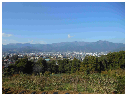
渋沢丘陵からの眺望