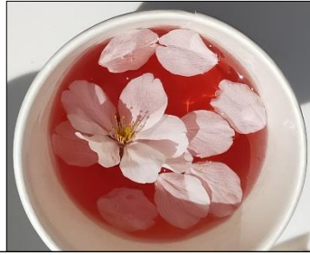
赤ワインに浮かぶ花吹雪