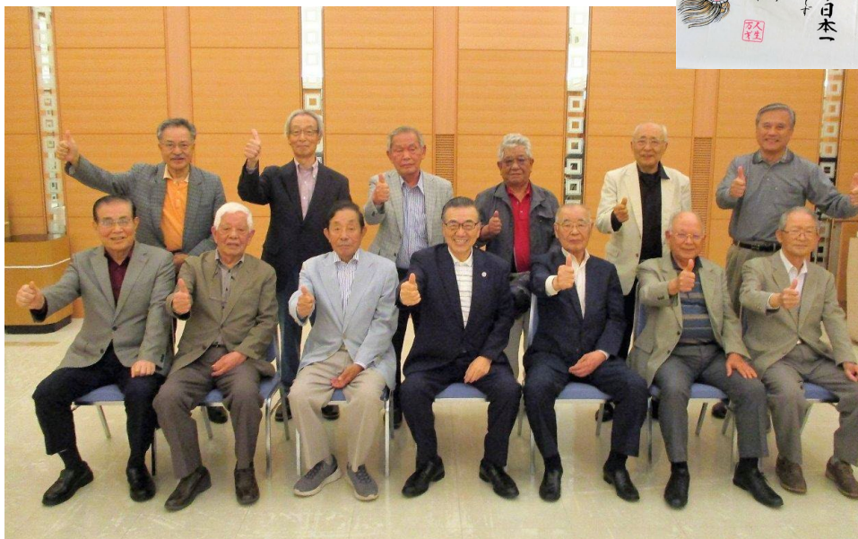
人生100年時代、笑って過ごそう👍(グー)