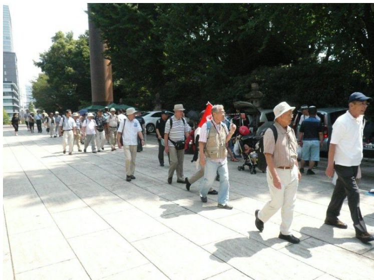
* 靖国神社境内から「遊就館」へ