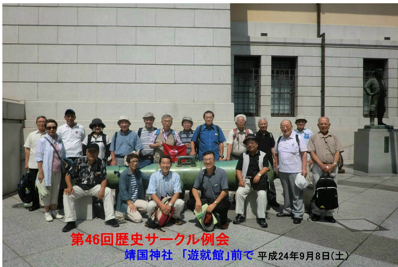
第46回歴史サークル例会 靖国神社「遊就館」前で 平成24年9月8日(土)