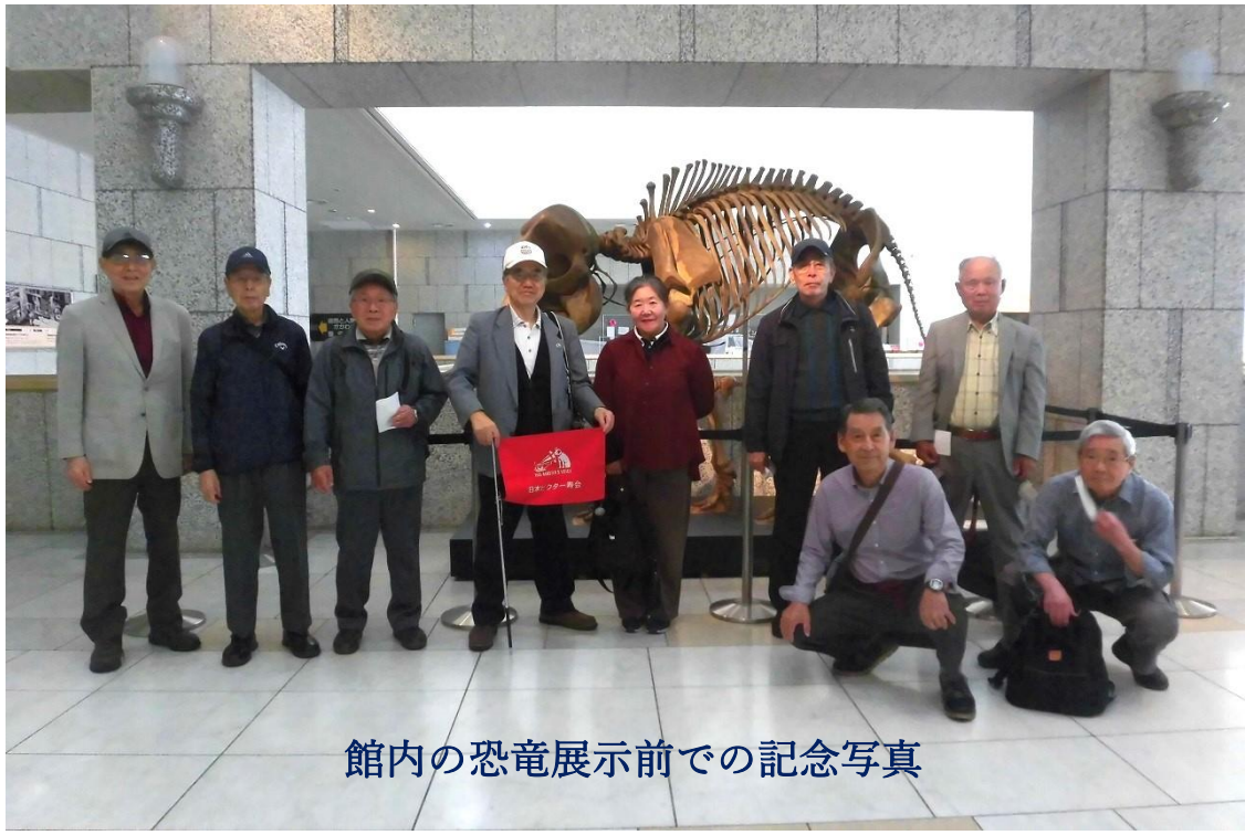
館内の恐竜展示前での記念写真

次に、県立青葉の森公園の木々の緑と咲き乱れる花々を愛でながら千葉寺（709年創建）へミニハイク。