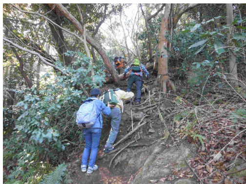
二子山への急峻な登り