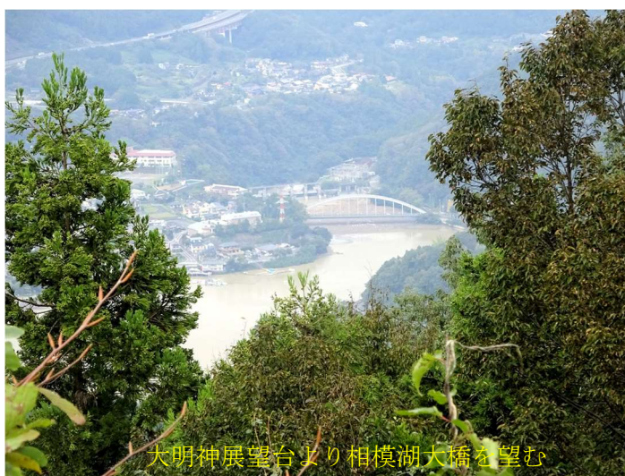
大明神展望台より相模湖大橋を望む