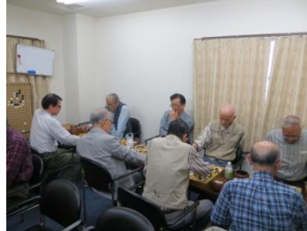
真剣な対局の様子